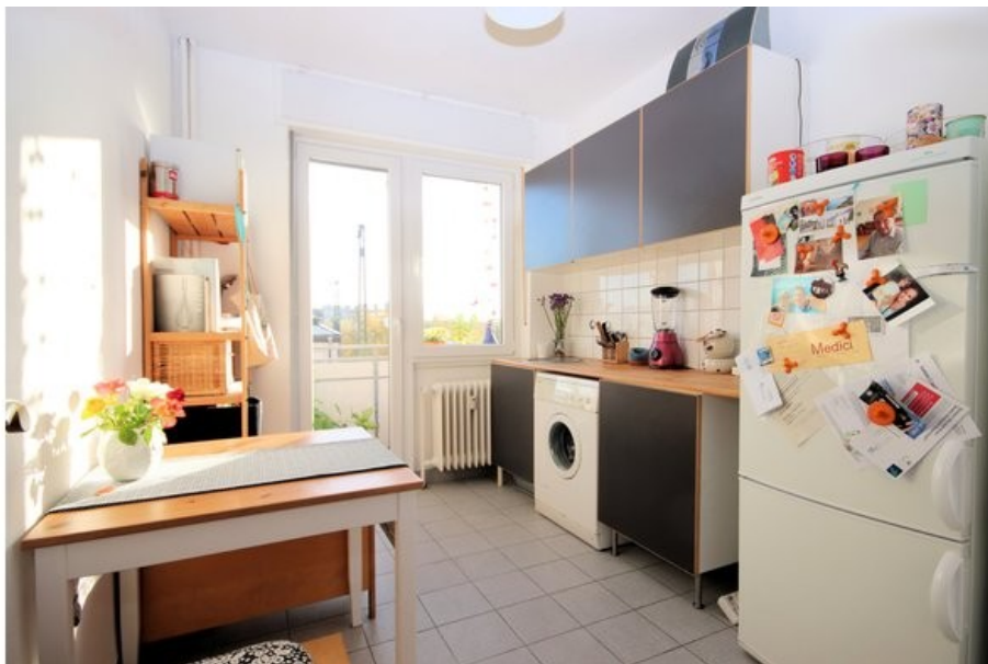
Die Küche mit Balkon