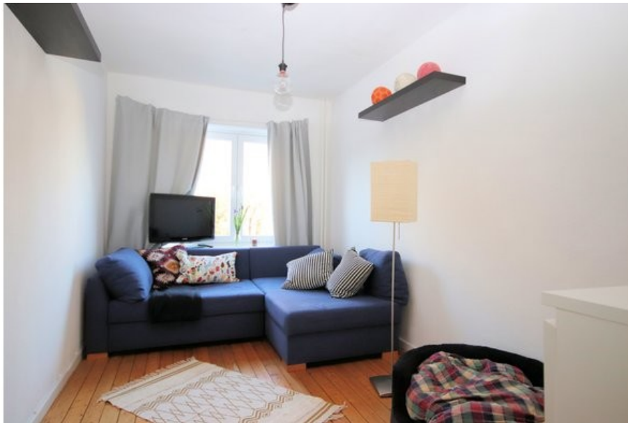
Wohn-oder Arbeits-/ Gästezimmer