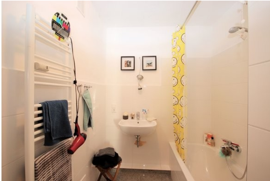
Das moderne Badezimmer