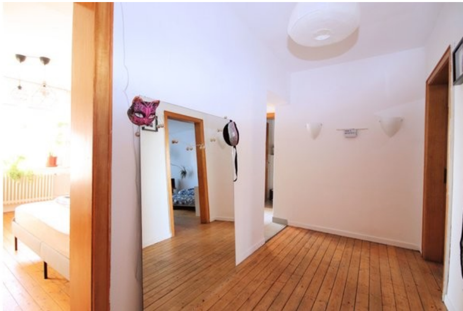
Der geräumige Flur