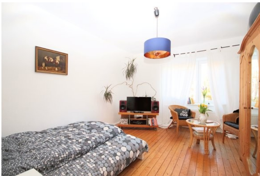
Das Wohn- momentan Schlafzimmer