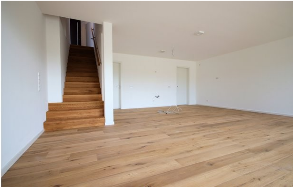
Der großzügige Wohn-, Ess- und Kochbereich