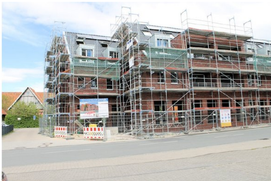
Die Baustelle - Ansicht Süd