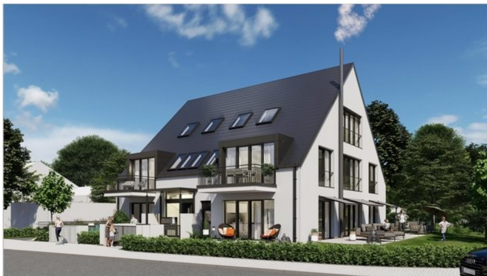
3D - 1