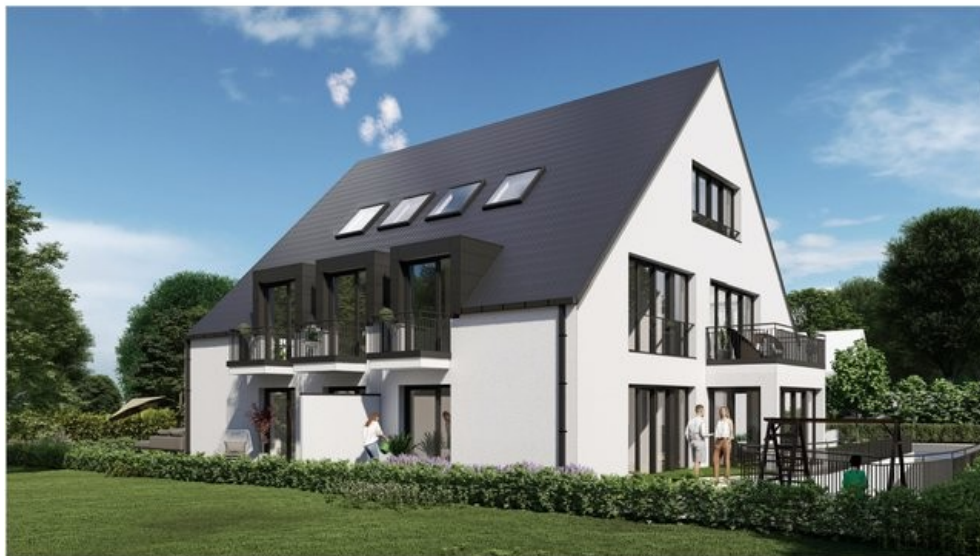
3D - 2