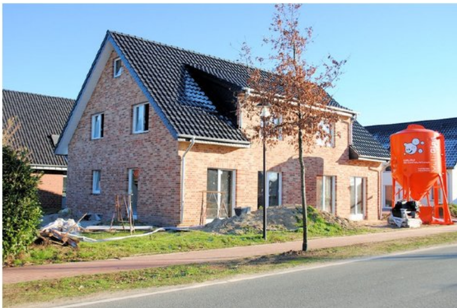
Kurz vor der Fertigstellung